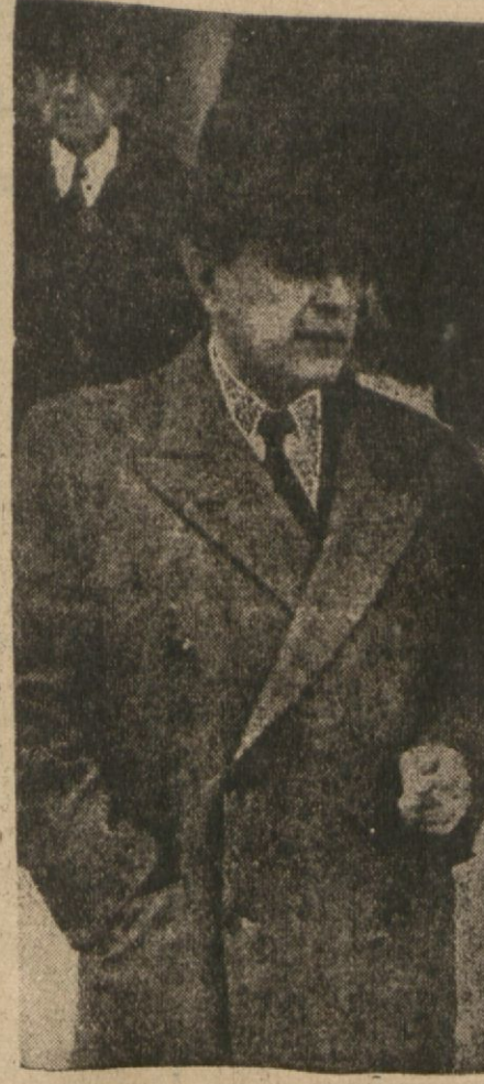
Yunan Başvekili B. Korizis — Yazısı üçüncüde —